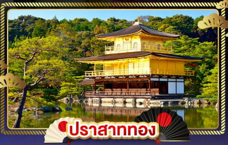
ปราสาททอง