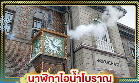
นาฬิกาไอน้ำโบราณ