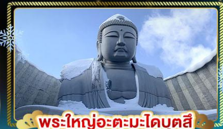
พระใหญ่อะตะมะโดบุตสึ