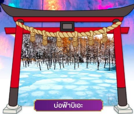
บ่อฟ้านิอะ