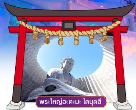
พระใหญ่อะตะมะ โดบุตสึ