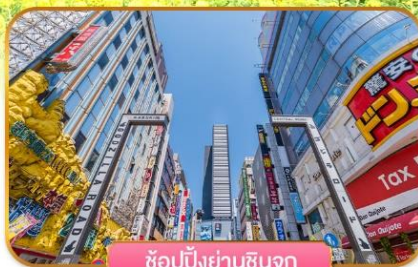
ช้อปบั้งย่านชินจุกุ