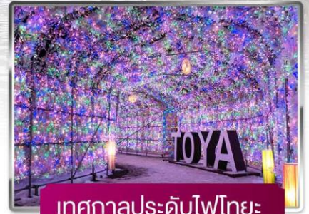
เทศกาลประดับไฟไทยะ