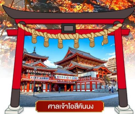
ศาลเจ้าโอสึคินนง