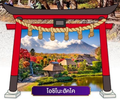
ไอเซโนะฮะคิ

เดินทางโดยสายการบิน : ไทยแอร์เอเชียเอ็กซ์