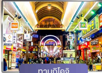
ทานุกิโคจิ