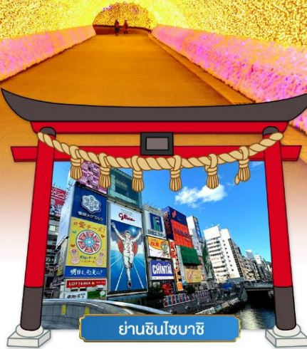
ย่านชินโซบาสึ