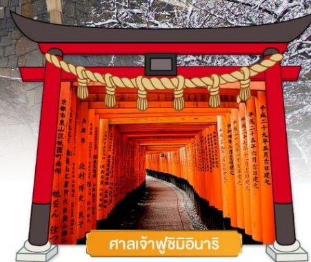
ศาลเจ้าฟูชิมิอินาริ

เดินทางโดยสายการบิน : ไทยแอร์เอเชียเอ็กซ์