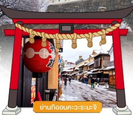
ย่านกิออนคะวะระมะจิ

✓ เพลิดเพลินกิจกรรมท่ามกลางหิมะ ในลานสกีแกรนด์ไฮไวโอคุบุคิ