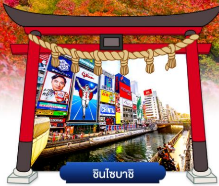
ชินโซบาชิ