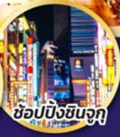
ช้อปปิ้งซินจุกุ