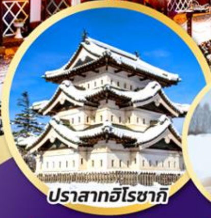
ปราสาทอิโรซากิ