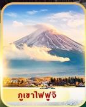
ภูเขาไฟฟูจิ