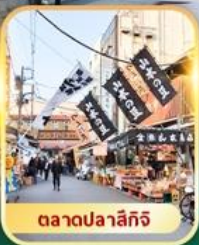
ตลาดปลาสึกิจิ