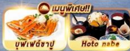
บุฟเฟ่ต์ซาปู