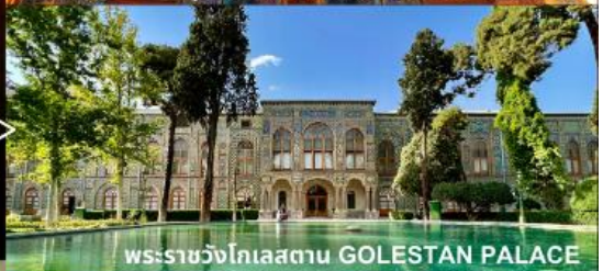
พระราชวังโกเลสถาน GOLESTAN PALACE