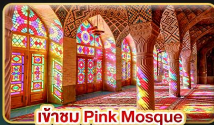
เข้าชม Pink Mosque