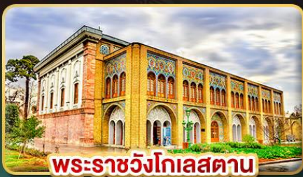
พระราชวังโกเลสถาน

เยือนอารยธรรมเปอร์เซีย เก็บครบทุกไฮไลต์สำคัญ