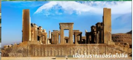
เมืองโบราณเปอร์เซโปลิส