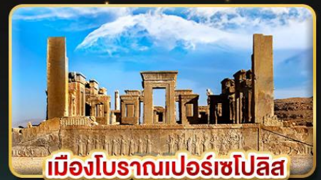
เมืองโบราณเปอร์เซโปลิส