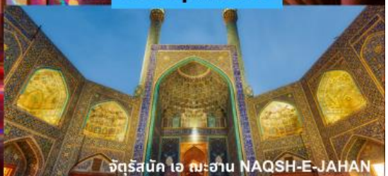
จัตุรัสเม็ก ไร่ สระชาน NAQSH-E-JAHAN