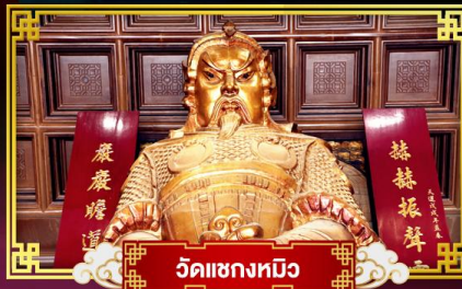
วัดเขกทหิว