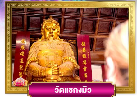
วัดแชกงมิง