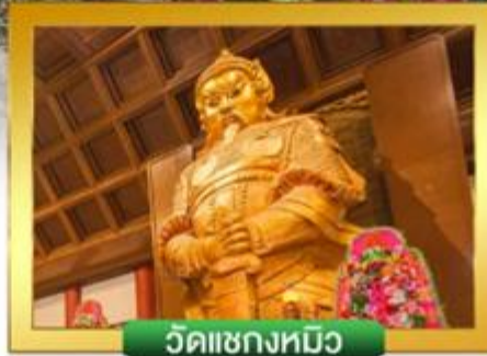
วัดเขกงทมิว