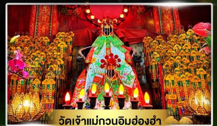
วัดเจ้าแม่กวนอิมฮ่องฮ่า