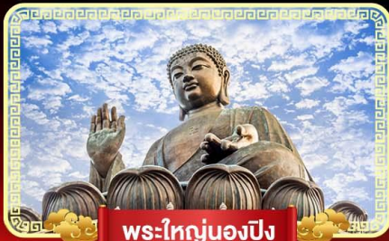
พระใหญ่ของปิง

พิธีเปิดท้องพระคลังเจ้าแม่กวนอิม บินลัดฟ้าไปมูสูเกาะฮ่องกง