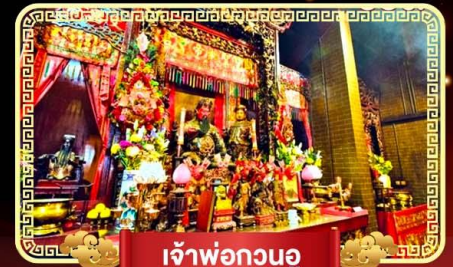
เจ้าพ่อกวนอู