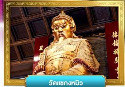
วัดเซ่งกทมิว