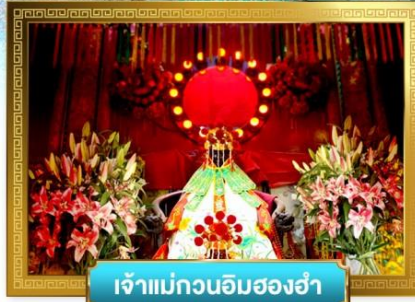
เจ้าแม่กวนอิมสองอำ