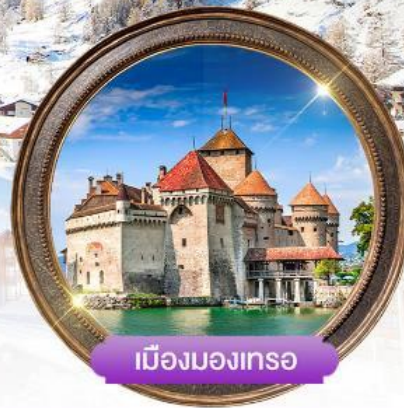
เมืองมงเทรซ