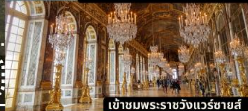
เข้าชมพระราชวังแวร์ซายส์