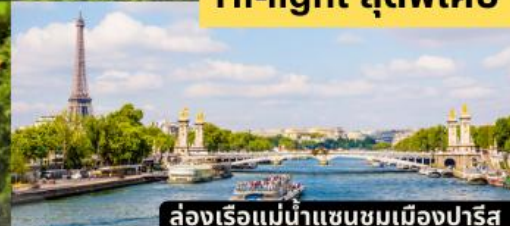
ล่องเรือแม่น้ำแซนชมเมืองปารีส