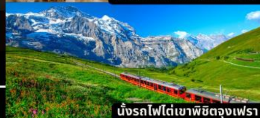
นั่งรถไฟใต้เขาพิชิตดงเฟรา