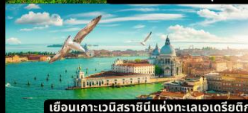
เยือนเกาะเวนิสราชมินแห่งทะเลเอเดรียติก