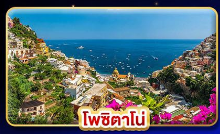
โพซิตาโน