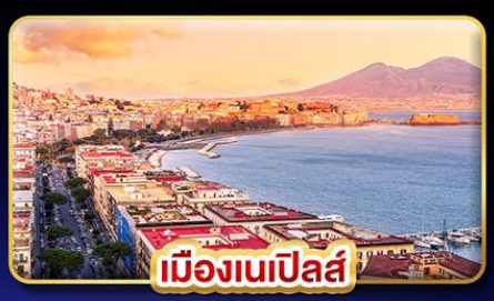
เมืองเนเป็ลส์