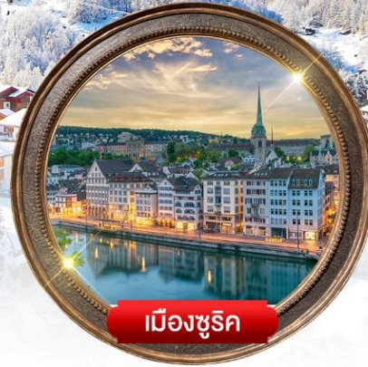
เมืองซูริก