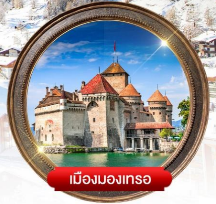
เมืองมงเทรอ