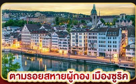
ตามรอยสหายผู้ทอง เมืองซูริค