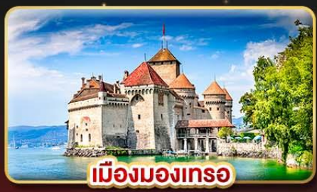
เมืองมงเทร