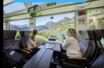
รถไฟ Panarama วิวสุดกว้าง