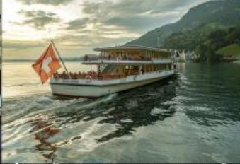
ล่องเรือชมวิวกะเสลาบลูเซิร์น