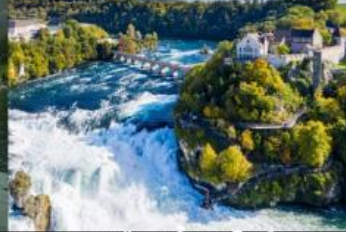
เขื่อนน้ำตกไรน์