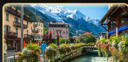
เยือนซาโมเน็กซ์ พิชิตมงบลังก์