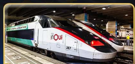
นั่งรถไฟความเร็วสูง PARIS - LYON

เดินทาง : 05-14 เม.ย. 68 | 29-08 พ.ค. 68