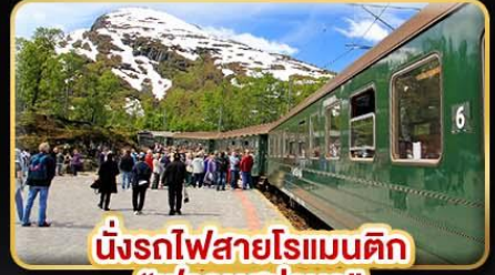
นั่งรถไฟสายโรแมนติก “พร้อมสปาน่า”