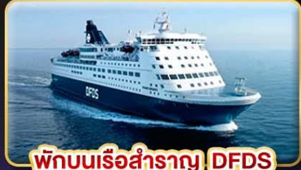
พิกบนเรือสำราญ DFDS