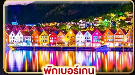
พิกเบอร์เกน