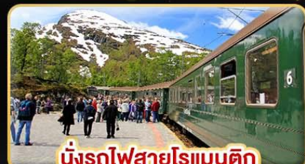
นั่งรถไฟสายโรแมนติก “ฟรอมสปานา”