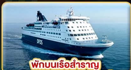
พักผ่อนเรือสำราญ แบบ Window Room 1 คืน