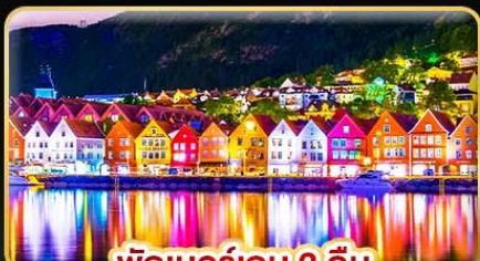
พักเบอร์เกน 2 คืน