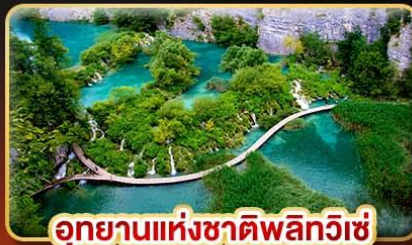
อุทยานแห่งชาติพลิทวิเช่