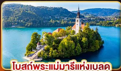
โบสถ์พระแม่มารีแห่งเบลด