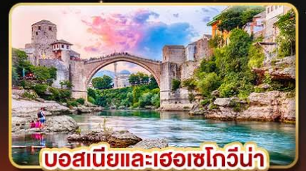
บอสเนียและเฮอร์เซโกวีนา