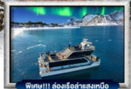
พิเศษ!!! ล่องเรือลำแสงเหนือ

บินหรู สายการบิน Full Service | พิเศษ! ไข่ปู King Crab