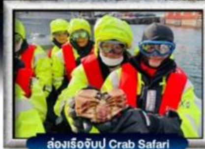
ล่องเรือจับปู Crab Safari