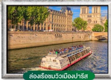
ส่องเรือชมวิวเมืองปารีส