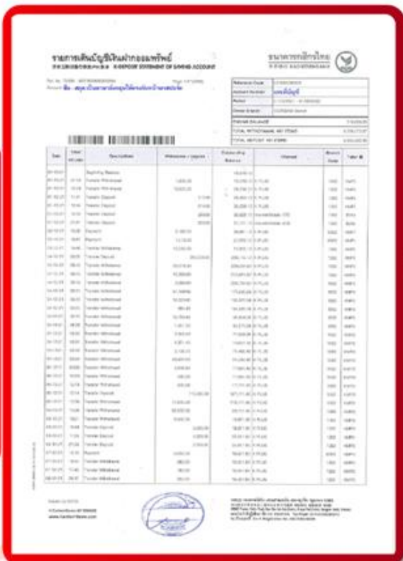
ตัวอย่าง Bank Statement ที่ผู้สมัครต้องขอจากธนาคาร

3.4 ปรับสมุดบัญชีธนาคารตัวจริง และเตรียมไปในวันที่ยื่นวีซ่า