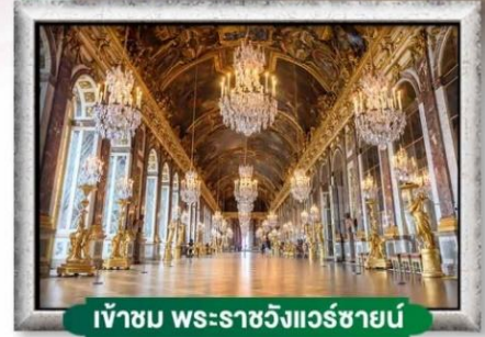
เข้าชม พระราชวังแวร์ซายน์