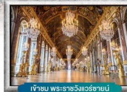
เข้าชม พระราชวังแวร์ซายน์