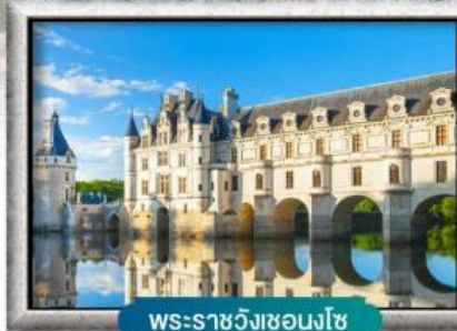
พระราชวังชองโซ