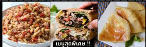
เมนูสุดพิเศษ !! KOSHARI (ข้าวคลุกถั่ว) / SHAWERMA (เนื้อห่อแป้ง) / FITEER BALADI (พืชข้าอียิปต์)