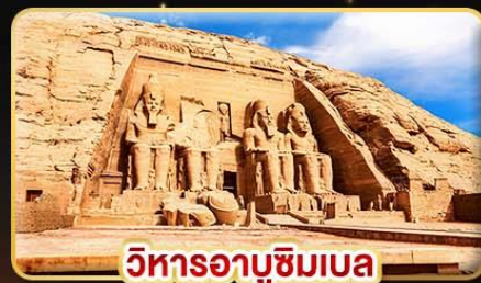
วิหารอาบูซิมเบล

น้ำหนักกระเป๋า 23Kg. (บินระหว่างประเทศ และบินภายใน)