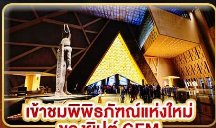
เข้าชมพิพิธภัณฑ์แห่งใหม่ ของอียิปต์ GEM