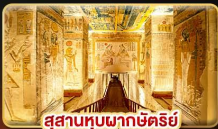
สุสานหุบผากษัตริย์