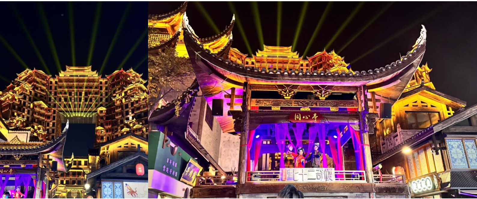
คำ บริการอาหารแบบ BOX SET

จากนั้นนำท่านชม ตึกมหัศจรรย์ 72 แห่งเมืองจางเจียเจี๋ย แลนด์มาร์คใหม่ล่าสุดที่เป็นเสมือนแม่เหล็กดึงดูดนักท่องเที่ยวและผู้มาเยือน ถูกสร้างขึ้นโดยนำเอาจุดเด่นของเมืองจางเจียเจี๋ยมารวมกัน โดยมีอาคารสูงที่สร้างจำลองถ้ำประตูสวรรค์ บ้านยกพื้นโบราณที่เป็นบ้านพื้นเมืองของชาวถู่เจีย นอกจากนี้ที่นี่ยังถูกออกแบบให้กลายเป็นแหล่งรวมของ รีสอร์ท โฮมสเตย์ ร้านอาหาร แผงสตรีทฟู้ด ผับบาร์ ร้านขายของที่ระลึก ที่ตกแต่งด้วยแสงสีสุดอลังการ (รวมบัตรเข้าชม)