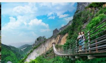
หุบเขารอยแยกอุ๋หลิงซาน