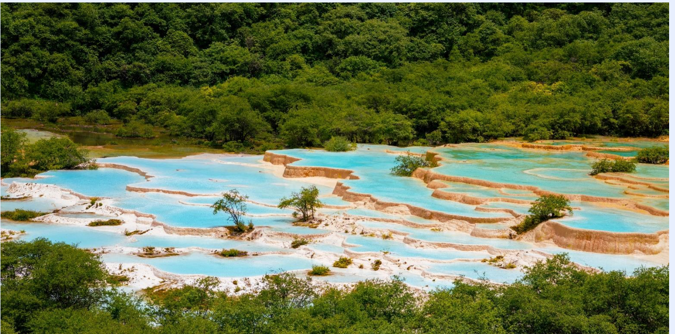
ฤดูใบไม้ผลิ (SPRING)

โปรแกรมทัวร์จีน CHENGDU ลีวจ้ายโกว หวงหลง สีดรุณี (CA) 6วัน 5คืน - รหัสทัวร์ CH5225360