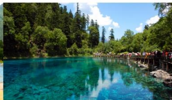
อุทยานแห่งชาติจื่อจ้ายโกว