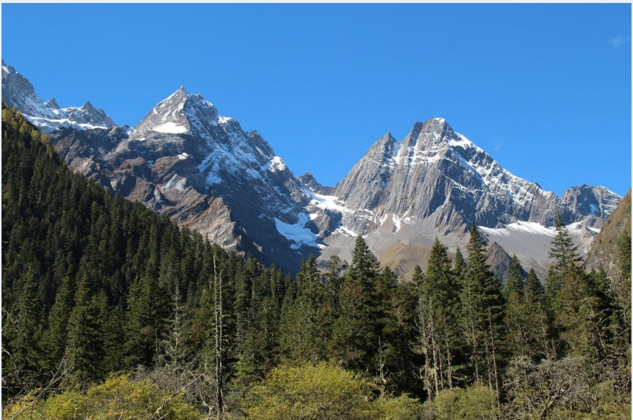
ฤดูใบไม้ผลิ (SPRING)

โปรแกรมทัวร์จีน CHENGDU ลีจ้ายโกว หวงหลง สีดรุณี (CA) 6วัน 5คืน - รหัสทัวร์ CH5225360