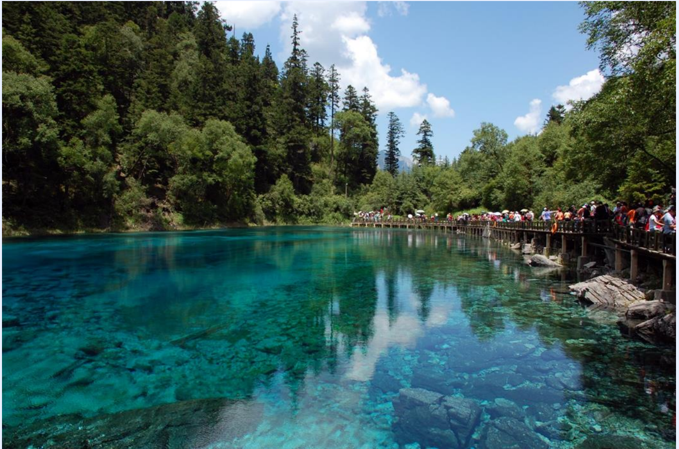
ฤดูใบไม้ผลิ (SPRING)

หมายเหตุ : โปรแกรมนี้ไม่รวมรถเหมาภายในอุทยานฯ หากท่านต้องการรถเหมาภายในอุทยาน มีค่าใช้จ่ายเพิ่มเติม สามารถสอบถามเพิ่มเติมจากไกด์ท้องถิ่นและหัวหน้าทัวร์