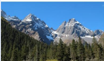
ภูเขาซีดรุณี (หุบเขาฉงเจียวโกว)