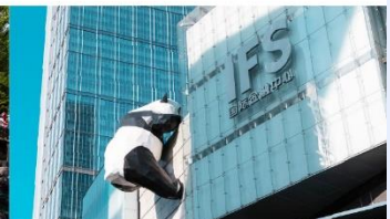
แพนด้ายักษ์ปิ่นตึก IFS

*ทางบริษัทฯ ขอสงวนสิทธิ์ในการสลับโปรแกรมทัวร์ตามความเหมาะสมขึ้นอยู่กับสถานการณ์หน้างาน โดยคำนึงถึงผลประโยชน์ของลูกค้าเป็นสำคัญ