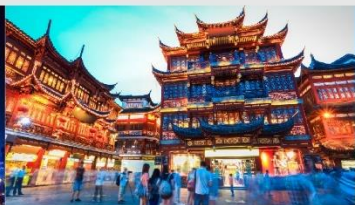
ตลาดร้อยปีเจินหวังเมี่ยว