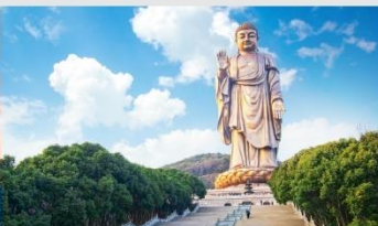
พระใหญ่หลิงชานต้าฝอ