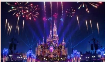
เซียงไฮ้ดิสนีย์แลนด์