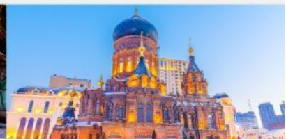
โบสถ์เซนต์ไอแซค