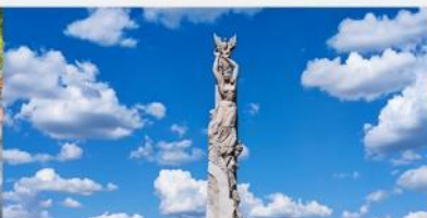
สวนประติมากรรมโลกฉางชุน