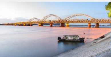
สะพานจงฮัวเจียง