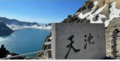
อุทยานฉางไป่ซาน