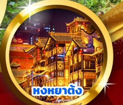
หงหยาดั่ง