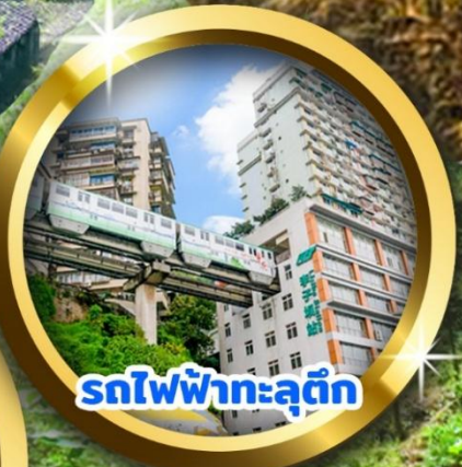
รถไฟฟ้าทะลุถ้ำ