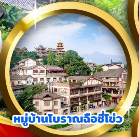
หมู่บ้านโบราณฉือชี่โฮ่ว