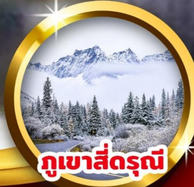
กุเขาสีดรุณี