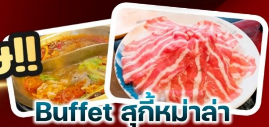
Buffet สุกี้หม่าล่า