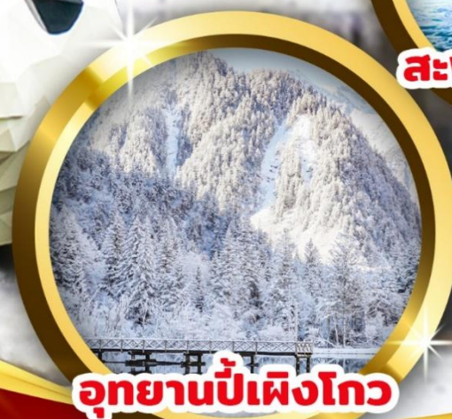
อุทยานปี้เฟิงโกว