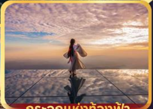
กระเจกแห่งท้องฟ้า

“อุ๋หยวน หมู่บ้านชนบทที่สวยงามที่สุดของจีน หวงหลิง หมู่บ้านโบราณสุดคลาสสิกอายุกว่า 580 ปี ภูเขาหลิงซาน สถานที่ศักดิ์สิทธิ์แห่งที่ 33 ของโลก หอเท็งหวัง หอโบราณที่มีชื่อเสียงแห่งเจียงหนาน”