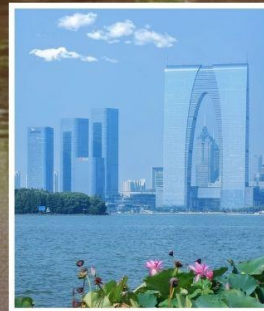
SUZHOU EAST GATE