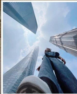
3 ตึกใหญ่ แห่งเมืองไฮ้