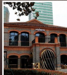
ย่านเฟิงเซินหลี่