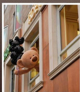
ถนนอันฟู่