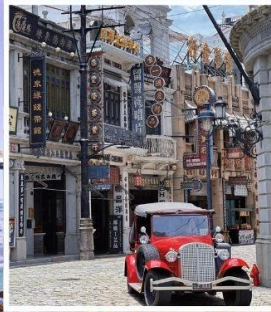
โรงถ่ายภาพยนตร์ เฟิงเสี่ยวกั๊ง