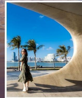
ห้องสมุดหยุนตง