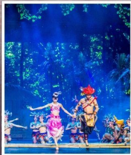
SANYA ROMANCE PARK