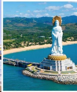
เจ้าแม่กวนอิม หนานซาน