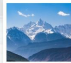
ภูเขาหิมะเหม่ยหลี่