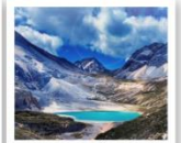
ทะเลสาบน้ำนม