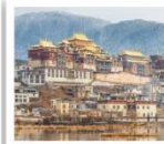
วัดจงจ้านหลิง