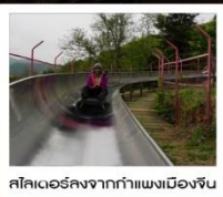
สไลเดอร์จากกำแพงเมืองจีน