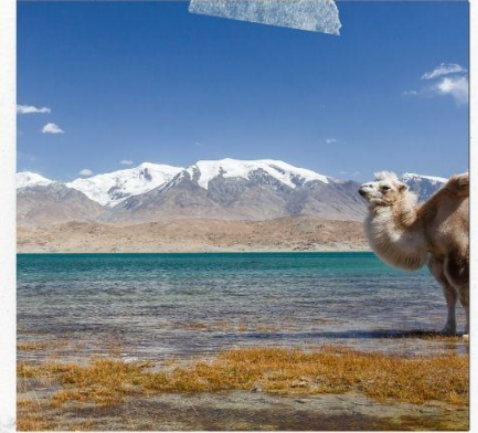
ทะเลสาบคาลาคู่เล่อ