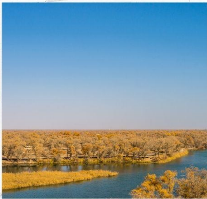
สวนต้นหุหยาง