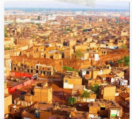
เมืองคาสือ