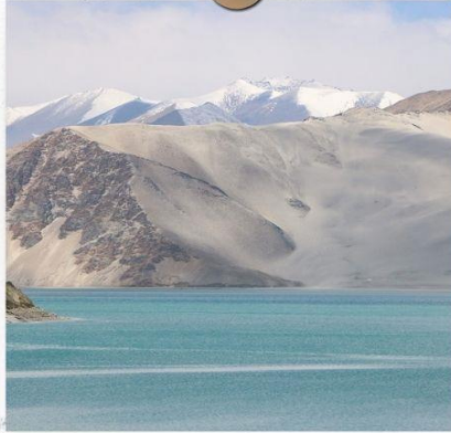
ทะเลสาบไปซาหุ