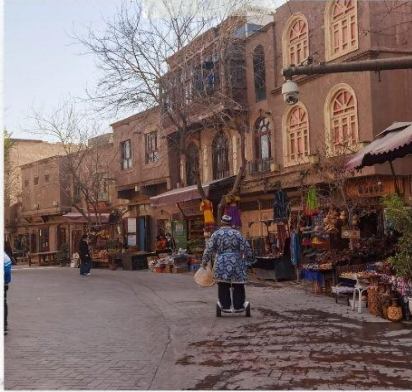
เมืองไบรานคัซการ์