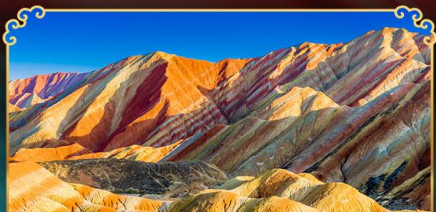
ภูเขาสายรุ้งจางเย่

เดินทางตามรอยเส้นทางสายประวัติศาสตร์โลก ชมโอเอซิสกลางทะเลทราย "ทะเลสาบพระจันทร์เสี้ยว"