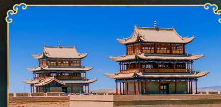
กำแพงเมืองจีนเจียวอ้วกวน