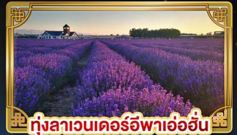
ทุ่งลาเวนเดอร์อีพาอ้อฮัน