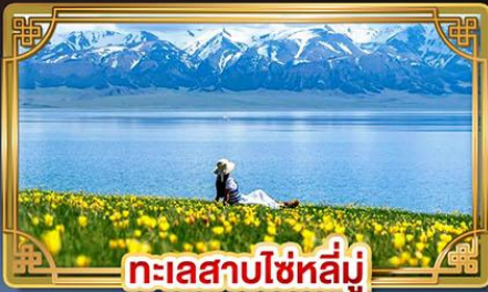
ทะเลสาบไซหลี่มู่