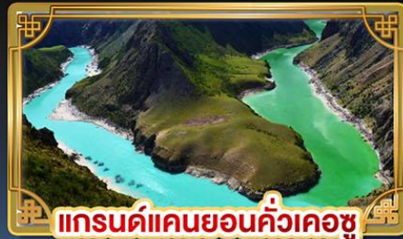
แกรนด์แคนยอนคั่วเคอซู