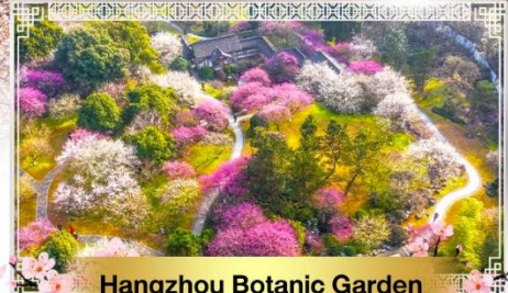
Hangzhou Botanic Garden