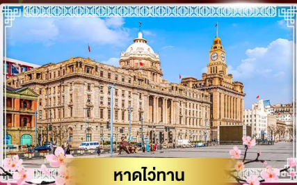
หาดวอทาน

“ชมดอกซากุระพลิ้วบาน ณ แดนมังกร” ล่องเรือทะเลสาบตะวันตก ไข่มุกแห่งหางโจว