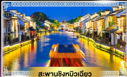
สะพานชิงทิวเจียว