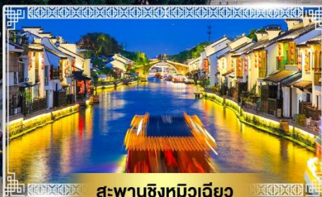
สะพานชิงหมิงเจียว